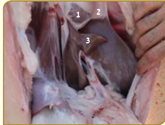
מקום חיבורו של הכבד בגוף מתחת לכליות כליה ימנית מסומנת במס' 1 וחלב הכליות מסומן במס' 2, ניתן להבחין באצבע הכבד (3).