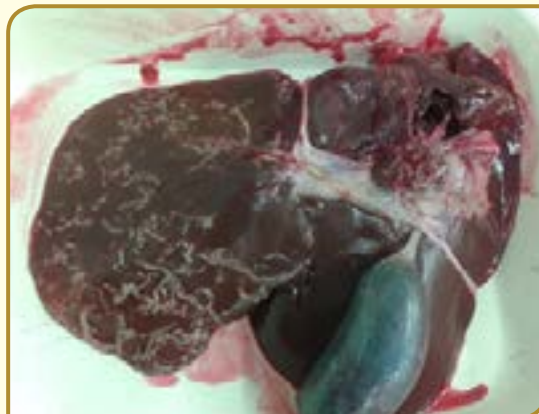
תולעים לבנות בכבד – כבד שהתליע אפילו במקום מרה ובמקום חיותו הבהמה כשירה, שוייע מא, ד.