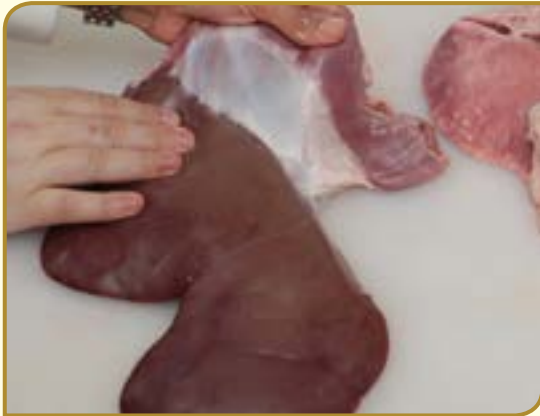
חיבור הכבד והטרפס