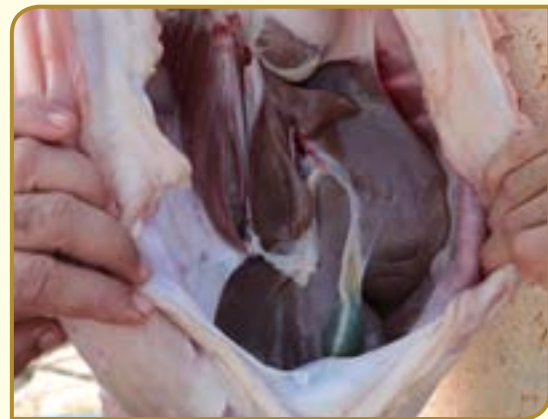
חיבור כיס המרה לכבד