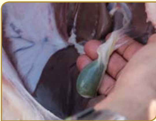
חיבור כיס המרה לכבד